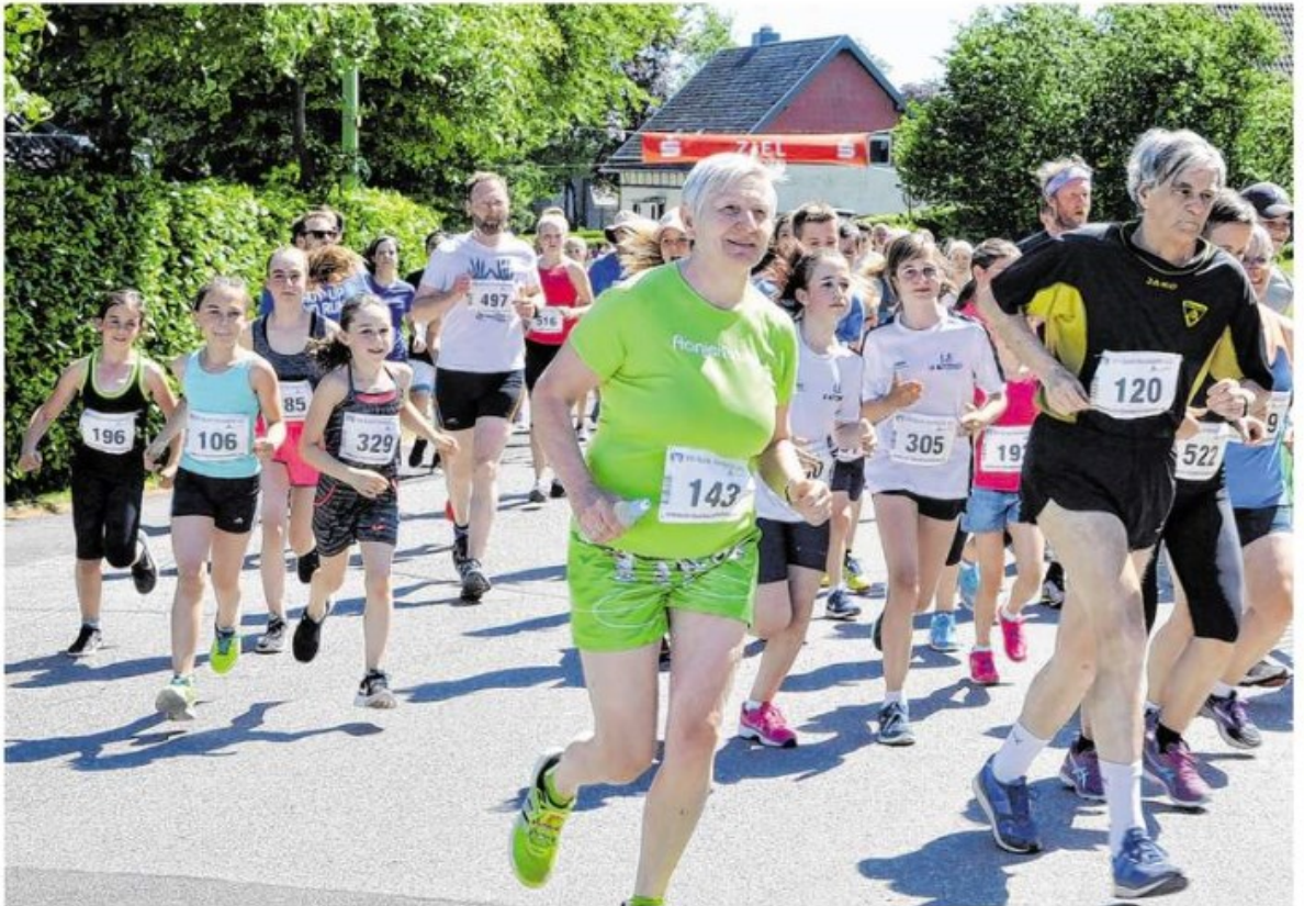
Die reizvollen Strecken, die Beliebtheit der Veranstaltung und die Schülerwettbewerbe werden auch in diesem Jahr dafür sorgen, dass beim Mützenicher Vennlauf Läuferinnen und Läufer aller Altersklassen und mit den unterschiedlichsten Ambitionen dabei sind.

Auch in diesem Jahr sind wieder attraktive Sachpreise zu vergeben. Zum 40. Jubiläum gibt es Sonder-